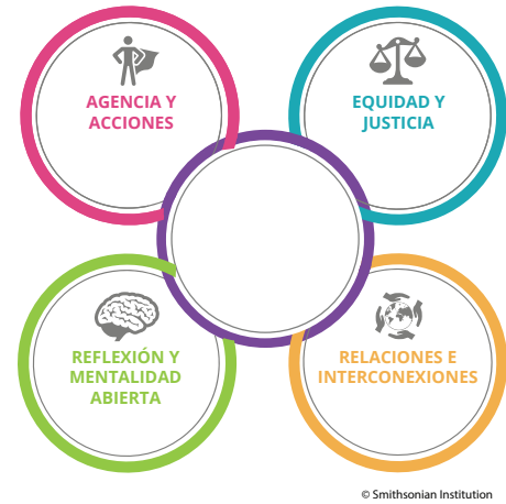
Figura 1: Mentalidades de sostenibilidad.