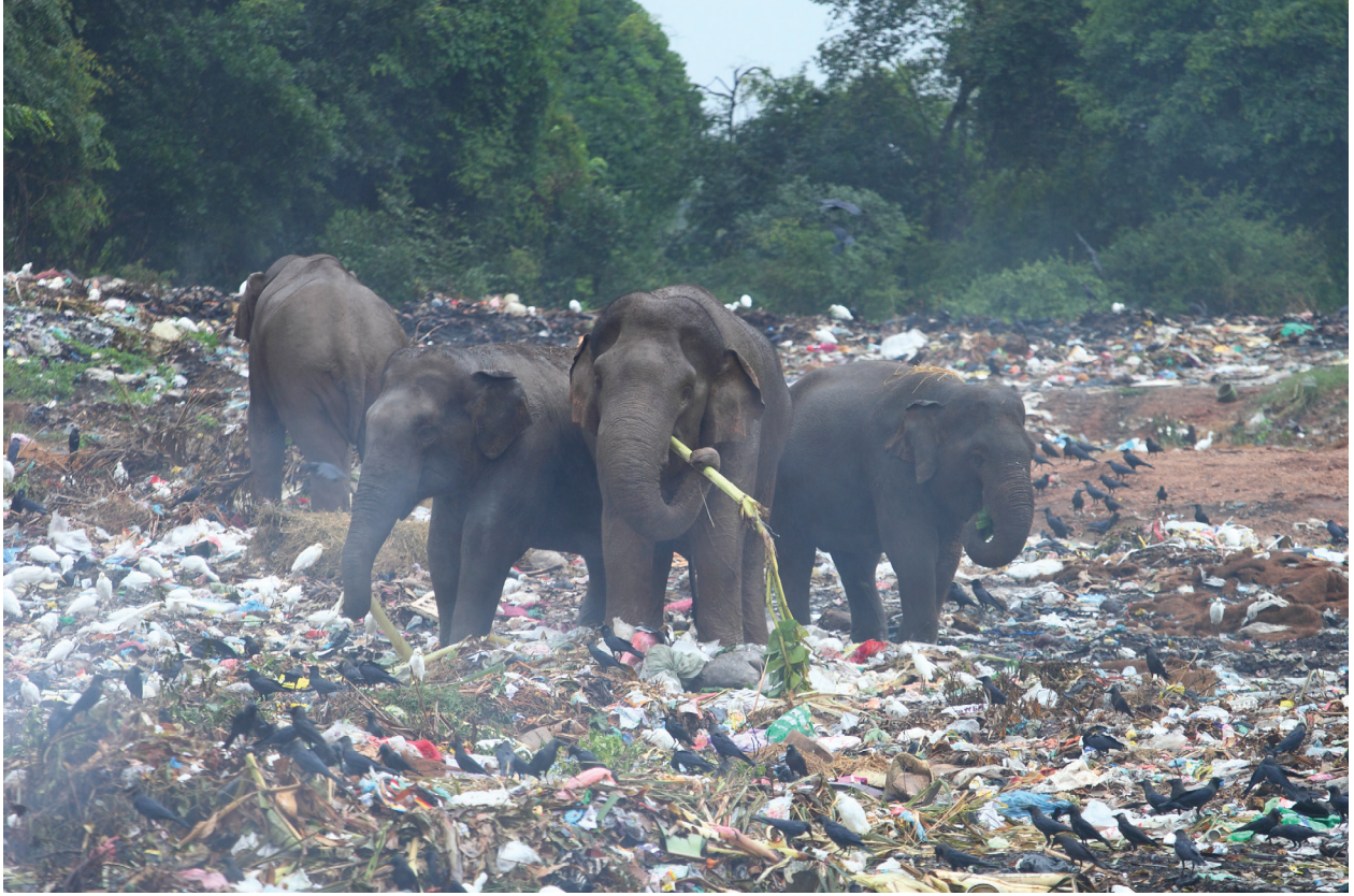
الشكل 1.3: تقف مجموعة من الفيلة وسط عملية إزالة غابة مليئة بالقمامة.

4. في دليل البحوث هذا، ستتعرف على معلومات واردة عن باحثين في أماكن أخرى. حيث يحاول هؤلاء الباحثون أيضًا فهم المشكلات في مجتمعاتهم المحلية. فهم يحاولون مساعدة مجتمعهم على تحقيق التوازن بين احتياجات البشر واحتياجات الكائنات الحية الأخرى. يمكن أن تعطيك المعلومات الواردة عن الباحثين أفكارًا حول بحوثك وأعمالك.