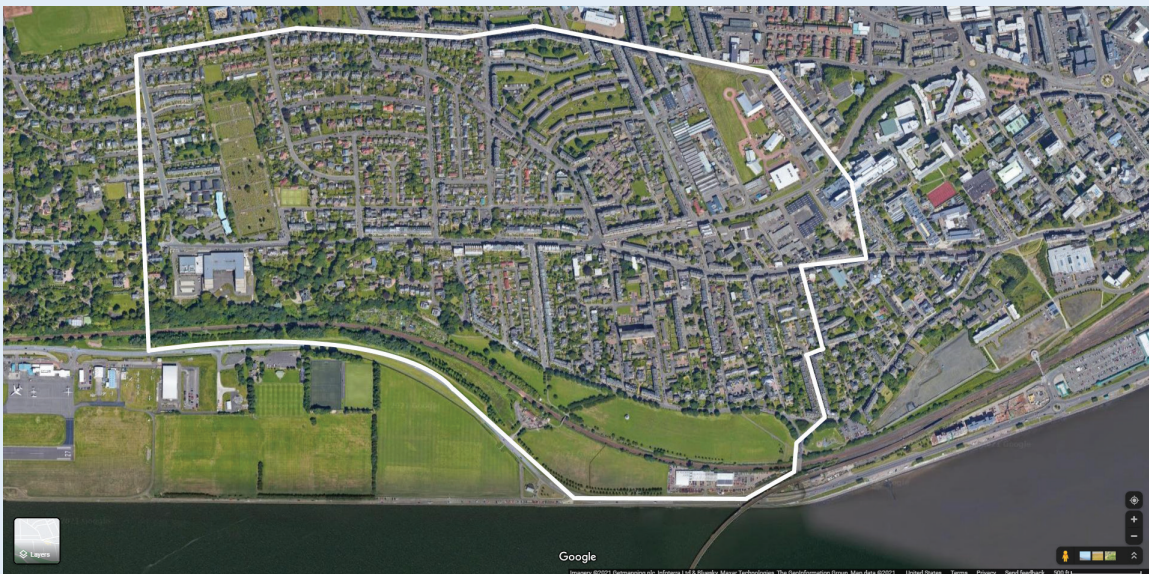
الشكل 1.5: مثال على استخدام خريطة موجودة لتحديد منطقة البحث