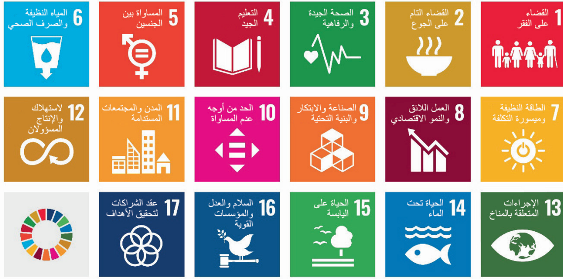
الشكل 1.4: أهداف التنمية المستدامة للأمم المتحدة

5. من ثَمَّ، اسرد أهداف مجتمك المتوازن على السبورة أو أي مكان آخر يمكن للجميع الوصول إليه.