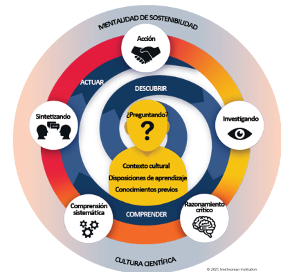
Figura 2: Progresión de la acción de los Objetivos Globales.

Por último, los jóvenes aplican tanto los conocimientos que ya tienen como la información que acaban de obtener. En primer lugar, consideran los cambios personales que podrían hacer para ayudar a que sus comunidades sean más sostenibles. Luego, en equipo, los jóvenes llegan a un consenso sobre lo que podrían